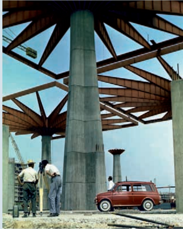
Era il 1961. L'Italia compiva cento anni. Cento anni di unità e di progresso. Torino ricordava l'avvenimento costruendo la sede principale delle celebrazioni: Palazzo Nervi, dal nome dell'architetto, conosciuto anche come Palazzo del Lavoro o Italia 61. Fu realizzato da Fiat Costruzioni. Nella foto uno dei cantieri.