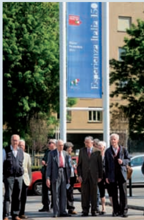
Il gruppo dei soci fiorentini durante la visita, e in alto, all'ingresso delle Ogr. Nella pagina precedente, uno scatto della mostra "Fare gli italiani".

bella, vivace, piena di cose da fare e da vedere. Li hanno colpiti le bandiere sventolare da finestre e balconi, visibile partecipazione patriottica che suscita nuove discussioni: il senso della Nazione, forte e radicato nelle vecchie generazioni, decisamente appannato in quelle giovani. L'unica considerazione negativa la merita il traffico: intenso e con troppi cantieri aperti.