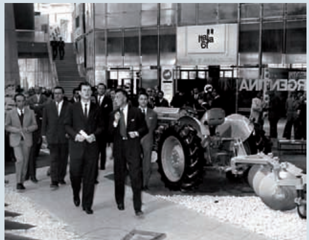
Gianni Agnelli fa gli onori di casa accompagnando il futuro senatore Ted Kennedy, fratello del Presidente Usa John, in visita all'esposizione